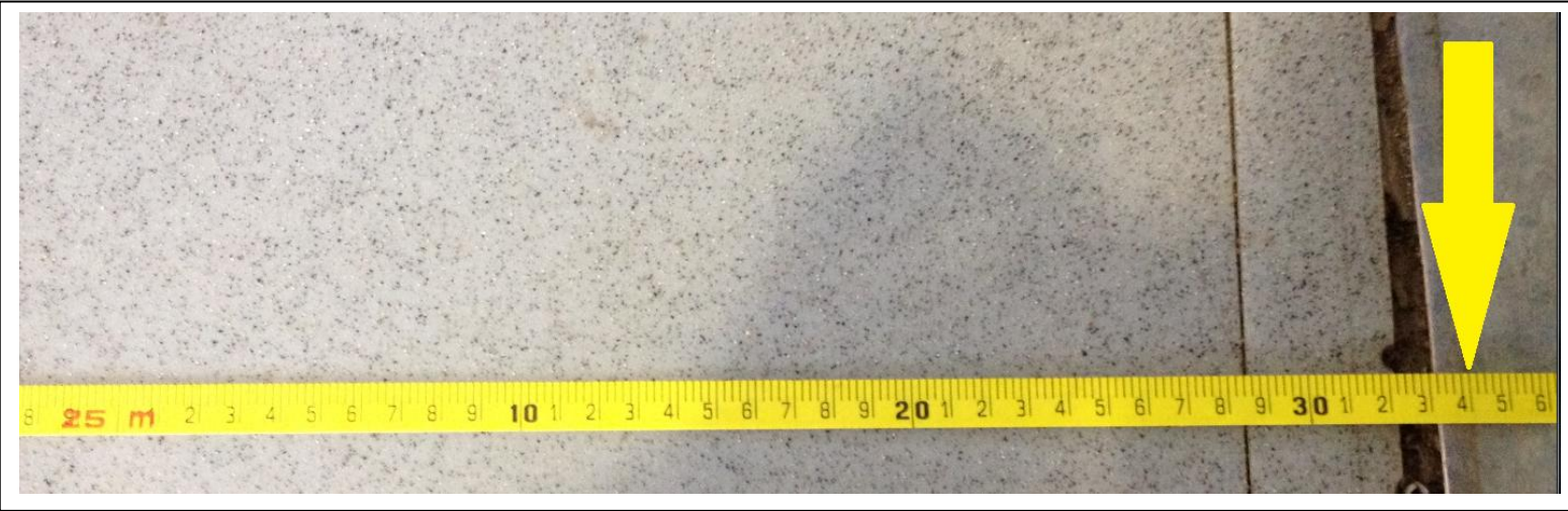
Mesure de la distance d parcourue par la trottinette (en mètre)