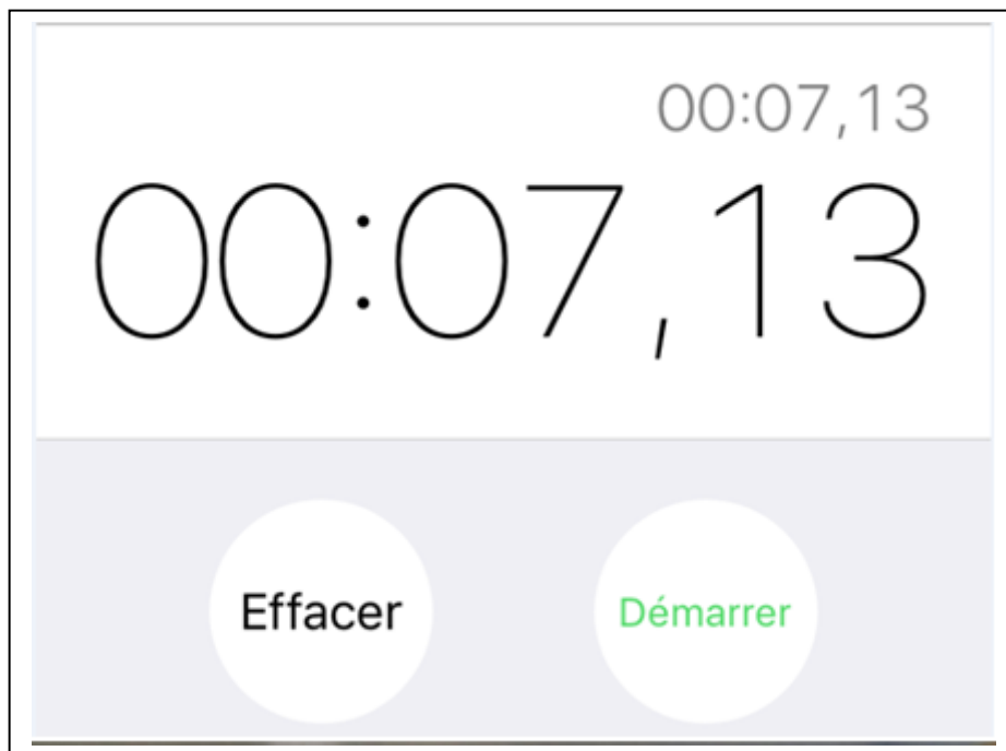
Mesure du temps t mis par la trottinette (en seconde) pour parcourir la distance d .