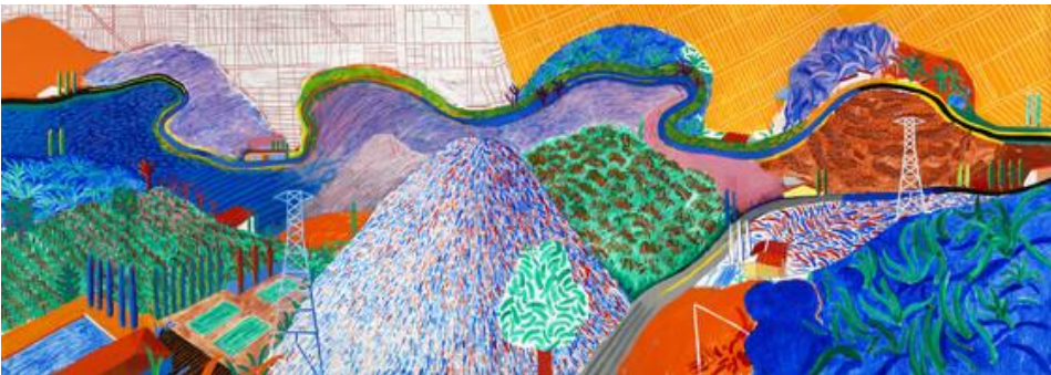
David HOCKNEY (1937- ), Mulholland Drive : la route du studio , 1980. Peinture acrylique sur toile. 218,44 × 617,22 cm. Musée d'art du comté de Los Angeles (LACMA). https://thedavidhockneyfoundation.org/artwork/3812